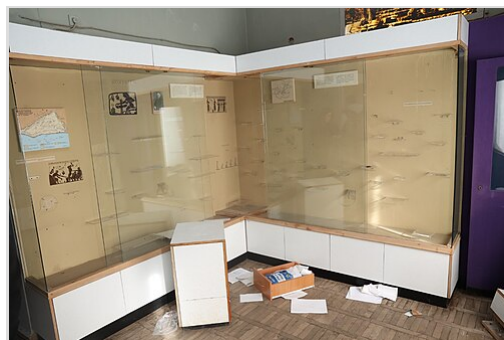
Musée local d'histoire de Kherson après avoir été pillé par les troupes russes

Des vidéos ont été publiées sur Telegram, montrant des soldats russes envoyant des marchandises ukrainiennes volées chez eux par le biais de services de messagerie en Biélorussie. Les articles visibles dans les vidéos comprenaient des unités de climatisation, de l'alcool, des batteries de voiture et des sacs des magasins Epicentr K . [252] L'agrégateur de nouvelles Ukraine Alert a publié une vidéo montrant des marchandises volées trouvées dans un véhicule blindé de transport de troupes russe abandonné, et une image montrant un camion militaire russe endommagé transportant trois machines à laver. Les appels téléphoniques interceptés ont également fait mention du pillage; un appel d'un soldat russe libéré par le service de sécurité de l'Ukraine comprenait le soldat disant à sa petite amie: "J'ai volé des cosmétiques pour vous" auquel la petite amie a répondu "Quelle personne russe ne vole rien?" [253] Voice of America a obtenu des photos indiquant que les troupes CDEK russes ont pillé des matières dangereuses de la centrale nucléaire de Tchernobyl , et une image de la Biélorussie montrant apparemment un camion militaire russe stationné à l'extérieur du bureau local du CDEK, ajoutant aux preuves