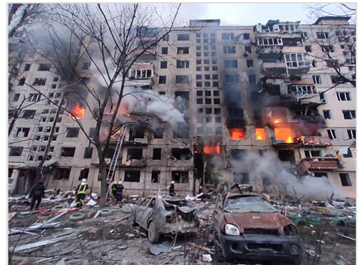
Bâtiments résidentiels bombardés à Kiev, le 14 mars 2022

La charte de la Cour pénale internationale définit les attaques contre les infrastructures civiles qui constituent des crimes de guerre. [53] La Mission de surveillance des droits de l'homme de l'ONU en Ukraine , a déclaré que la Russie avait commis des attaques aveugles et des frappes sur des biens civils comme des maisons, des hôpitaux, des écoles et des jardins d'enfants. [44] Le 25 février, Amnesty International a déclaré que les forces russes avaient "montré un mépris flagrant pour les vies civiles en utilisant des missiles balistiques et d'autres armes explosives ayant des effets étendus dans des zones densément peuplées". La Russie a faussement affirmé qu'elle n'utilisait que des armes à guidage de précision , a déclaré Amnesty, et les attaques contre Vuhledar, Kharkiv et Uman, étaient probablement des crimes de guerre. [5]