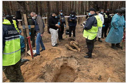
Des corps exhumés de fosses communes à Izioum

Le 15 septembre 2022, après que les forces russes ont été chassées d'Izioum des centaines de tombes avec de simples croix en bois, la plupart d'entre elles marquées uniquement avec des chiffres, ont été trouvées dans les bois près de la ville. [88][89] L'une des plus grandes tombes portait un marqueur disant qu'elle contenait les corps d'au moins 17 soldats ukrainiens. [88] Les enquêteurs ukrainiens ont déclaré que 447 corps avaient été retrouvés: 414 civils (215 hommes, 194 femmes, 5 enfants), 22 soldats et 11 corps dont le sexe n'avait pas encore été déterminé au 23 septembre. Alors que certaines victimes ont été causées par des tirs d'artillerie 90 et le manque de soins de santé [91] , la plupart présentaient des signes de mort violente et 30 de torture et d'exécution sommaire, y compris des cordes autour du cou, des mains liées, des membres brisés et de l'amputation génitale. 92][93]