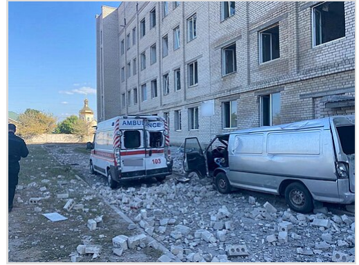
Hôpital de Beryslav (région de Kherson) après des bombardements russes, le 5 octobre 2023

Le 7 mars 2022, les forces armées ukrainiennes auraient pris position dans une maison de soins dans le village de Stara Krasnianka, près de Kreminna, dans l'oblast de Lougansk, en raison de l'emplacement stratégique de la maison, l'évacuation étant apparemment impossible en raison de l'exploitation minière. Le 11 mars 2022, les forces affiliées à la Russie ont attaqué la maison de soins avec des armes lourdes tandis que 71 patients handicapés et 15 membres du personnel étaient toujours à l'intérieur. Un incendie s'est déclaré et une cinquantaine de personnes sont mortes. Le bureau du procureur général ukrainien a annoncé des accusations de crimes de guerre contre la Russie pour l'attaque. La zone était sous contrôle russe, et les enquêteurs ukrainiens n'avaient pas pu accéder au site. [143] Le HCDH a publié un rapport qui a conclu que la Russie n'avait commis aucun crime de guerre, ni que l'Ukraine utilisait des boucliers humains, mais il s'est inquiété des allégations de cela. Le rapport a révélé que les forces ukrainiennes occupaient le bâtiment avant l'attaque, de sorte que les patients à domicile ne sont pas la cible prévue. [144][15][146]