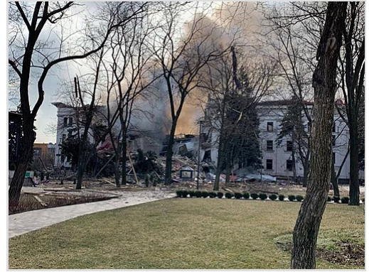
Le théâtre dramatique de Marioupol a été pour la plupart détruit le 16 mars 2022, tout en abritant au moins 1.300 personnes à l'intérieur [164]

Tchernihiv, [170] le complexe commémoratif de l'Holocauste de Babyn Yar à Kiev , le bâtiment Slovo de l'ère soviétique [167] et le bâtiment de l'administration régionale de l'État à Kharkiv Zhytomyr Oblast [172] Historical and Local History Museum in Ivankiv. [173] Le 24 juin, l'UNESCO a déclaré qu'au moins 150 sites historiques ukrainiens, bâtiments religieux et musées ont été confirmés comme ayant subi des dommages pendant l'invasion russe. [174]