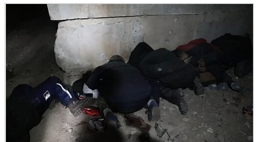
Civils exécutés avec des poignets liés dans des contentions en plastique, dans un sous-sol à Bucha, le 3 avril 2022