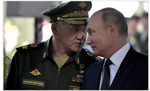
Des mandats d'arrêt pour crimes de guerre ont été émis par la CPI contre le président russe Vladimir Poutine (à droite [351] ) et le ministre russe de la Défense Sergueï Choïgou (à gauche). [352]

Le 27 février, l'Ukraine a déposé une requête auprès de la Cour internationale de Justice faisant valoir que la Russie avait violé la Convention sur le génocide en utilisant une accusation de génocide non fondée afin de justifier son agression contre l'Ukraine. [364] [365]