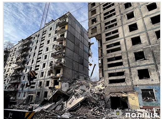
Damage to a residential building in Ukrainian-controlled Zaporizhzhia following the airstrike of 9 October 2022