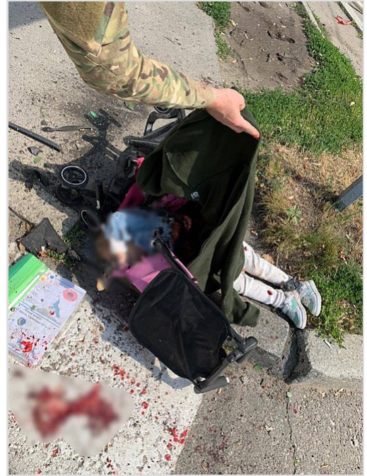
Corps d'un enfant tué dans une attaque de missile russe sur le centre-ville de Vinnytsia

Une vidéo de drone vérifiée par le New York Times a montré deux véhicules blindés russes tirant sur un civil marchant sur un vélo. Une vidéo ultérieure a montré le corps couché à côté d'un vélo. [72] The Economist a rapporté qu'un homme piégé à un point de contrôle qui a pris des tirs d'artillerie alors a été capturé, battu et torturé, puis emmené à l'extérieur pour être abattu. Il a joué à mort