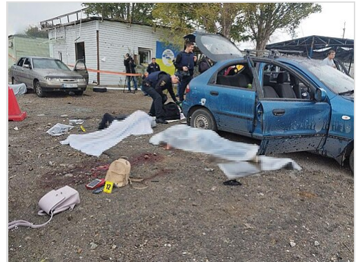
Des civils ukrainiens tués lors de l'attaque de convoi civil de Zaporijjia par l'armée russe avec des systèmes de missiles S-300 en septembre 2022

Selon les autorités régionales ukrainiennes, au moins 25 civils, dont six enfants, ont été tués dans des attaques contre des voitures qui tentaient de fuir Tchernihiv, ou attaqués dans des lieux publics; l'un de ces incidents a impliqué le meurtre d'un garçon de 15 ans le 9 mars, enquêté par la BBC et rapporté le 10 avril. [1] Le 2 mai, un rapport de Human Rights Watch a documenté trois incidents dans les oblasts de Kiev et de Tchernihiv où des Russes tiraient sur des voitures de passage, tuant six civils et en blessant trois. Des récits de témoins et des enquêtes sur place ont révélé que les attaques étaient probablement délibérées et ont suggéré que les Russes ont également tiré sur d'autres véhicules. [3]