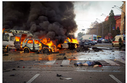
Des civils tués et des voitures détruites dans des frappes de missiles russes sur Kyiv, le 10 octobre 2022