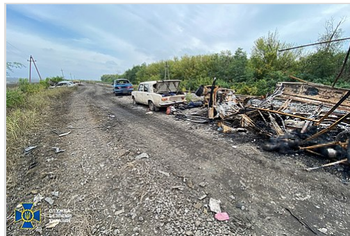
Après l'attaque du convoi civil à Kupiansk

[122] [123] 22 personnes ont réussi à s'échapper, dont 3 (dont 2 enfants) blessés. [122] dans les jours suivants, 2 autres corps ont été retrouvés, le bilan final étant de 26. [124] Une partie des preuves matérielles (les corps des victimes et de la voiture) a été examinée par des experts français. Ils ont découvert des signes d'utilisation d'obus explosifs de 30 mm et 45 mm, ainsi que de grenades VOG-17 et VOG-25 . [125]