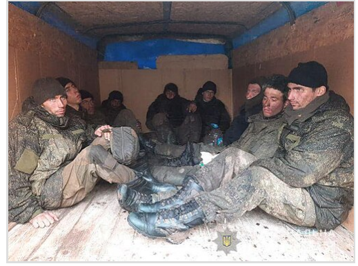
Des soldats russes capturés pendant la bataille de Sumy.

Le 6 avril 2022, une vidéo montrant des troupes ukrainiennes de la Légion géorgienne exécutant des soldats russes capturés a été publiée sur Telegram. [16] La vidéo a été vérifiée par le New York Times et par Reuters. [298][299] Un soldat russe blessé a apparemment été abattu deux fois par un soldat ukrainien alors qu'il était allongé sur le sol. Trois soldats russes morts, dont un avec une blessure à la tête et les mains attachées dans le dos, ont été montrés près du soldat. La vidéo semblait avoir été filmée sur une route au nord du village de Dmytrivka, à sept milles au sud de Boutcha . [300] Les autorités ukrainiennes ont promis une enquête. [301]