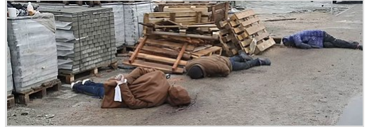
Des corps de civils abattus par des soldats russes se trouvent dans une rue de Boutcha, le 3 avril 2022. Les mains d'une victime sont attachées dans son dos.

Le 17 mars 2023, la CPI a émis des mandats d'arrêt contre Vladimir Poutine et Maria Lvova-Belova au sujet d'allégations d'implication dans le crime de guerre d'enlèvements d'enfants lors de l'invasion de l'Ukraine. [12] [13] En 2024, la CPI a émis des mandats d'arrêt contre les principaux officiers militaires russes Sergueï Choïgou, Valery Gerasimov, Sergueï Kobylash et Viktor Sokolov pour crimes de guerre présumés d'attaques contre des civils et des biens civils en