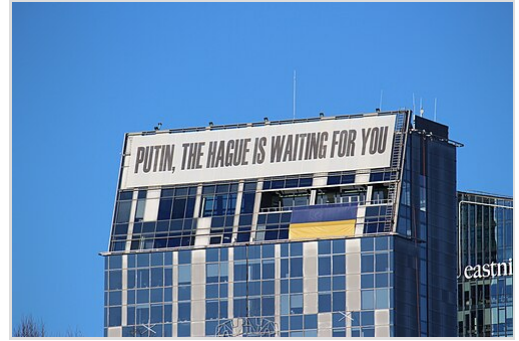
Bannière soulevée par la municipalité de Vilnius City .

Le 3 avril 2022, le ministre français des Affaires étrangères, Jean-Yves Le Drian , a décrit les exactions commises par les forces russes dans les villes ukrainiennes, en particulier Boutcha, comme de possibles crimes de guerre. [389] Le 7 avril, le président français Emmanuel Macron a déclaré que les meurtres dans la ville ukrainienne de Boutcha étaient "très probablement des crimes de guerre". [390]