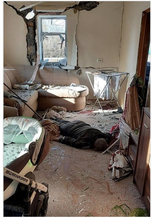
Un civil ukrainien tué lors du bombardement russe de Tchernihiv, le 28 février 2022

Le 7 mars, un drone des Forces de défense territoriale ukrainiennes près de l'autoroute E40 à l'extérieur de Kiev a filmé des troupes russes tirant sur un civil les mains en l'air. [63] Lorsque les forces ukrainiennes ont repris la zone quatre semaines plus tard, une équipe de presse de la BBC a retrouvé les corps brûlés de l'homme et de sa femme près de leur voiture brûlée. Au